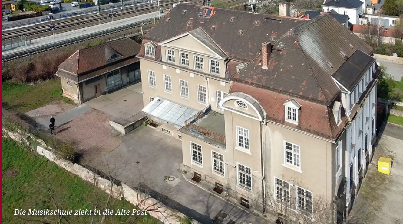
Die Musikschule zieht in die Alte Post

Informationen rund um das Sanierungsgebiet „Zentrum Radebeul-West“