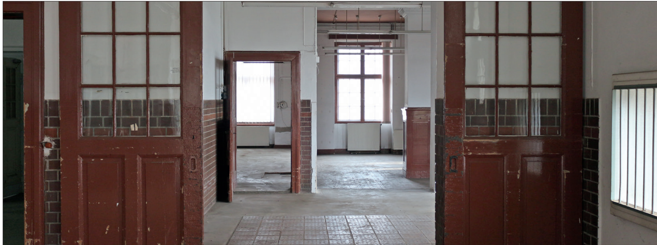
Musik liegt in der Luft: Die Umsetzung der Baumaßnahmen soll voraussichtlich in den Jahren 2023/24 erfolgen, sodass ab dem Spätsommer 2024 die Musikschüler ihr neues Quartier beziehen können. Musikschule und Stadtteilzentrum West werden sich dann – so die Hoffnung – ideal ergänzen und befruchten. Schülerinnen und Schüler profitieren von den großzügigen, modernen Räumlichkeiten und der hervorragenden Verkehrsanbindung.

Gute Gründe machten es den Stadträtinnen und Stadträten leicht, der Beschlussvorlage zur Ansiedlung der Musikschule in Radebeul-West zuzustimmen. Im Rahmen des Sanierungsgebietes fördern Bund, Land und Stadt das Vorhaben jeweils mit 1,9 Mio EUR bzw. insgesamt 5,7 Mio EUR.