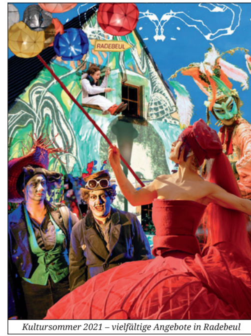
Kultursommer 2021 – vielfältige Angebote in Radebeul

auf der Streuobstwiese können die Besucher in die Welt von Karl May eintauchen, mit Musik, Tanz und Geschichten aus dem Orient. Am 17. und 18. Juli geht die Kunst wieder in Gärten. Bei diesem Open Air Format für Bildende Kunst aber auch für Gartenkultur öffnen wie im letzten Jahr private Gärten und Künstlergärten und ermöglichen besondere Einblicke und Begegnungen. Am 24. Juli kommt die Karawane der Lebenslust nach Altkötzschenbroda, ein tolles Spektakulum mit Musikern, Gauklern, Tänzern und Akrobaten wird den Dorfanger zur Abendstunde verzaubern und pure Lebensfreude versprühen. Mit all diesen Formaten sollen Kunst & Kultur auch dem Einzelhandel und der Gastronomie Impulse geben und insgesamt für einen lebendigen Stadtraum sorgen. Die Termine vom Frischemarkt in Radebeul-West: 17. Juli, 21. August und 18. September 2021.